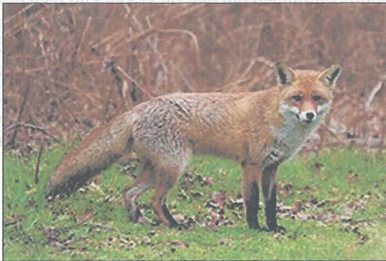
Ræv ( Vulpes vulpes )

Bladet udgivet af Astrup Vig Grundejerforening