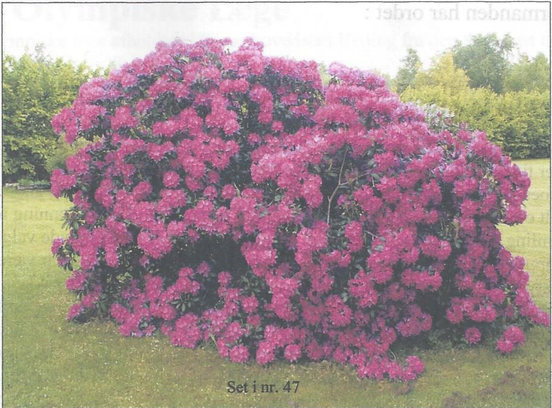
Set i nr. 47